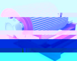
平滑陶瓷包胶（用于改向滚筒）

滚筒作为皮带输送机主要设备部件，负荷及磨损重、连续作业时间长，这要求滚筒具有较高的耐磨性、极高抗拉力及抗撕裂性能。而传统